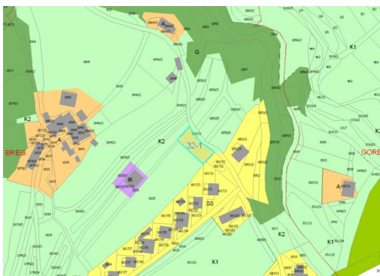
Slika 3: OPN s prikazom opredeljene pobude