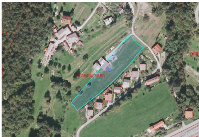
Slika 1: DOF (prikaz stanja) s prikazom prejete pobude